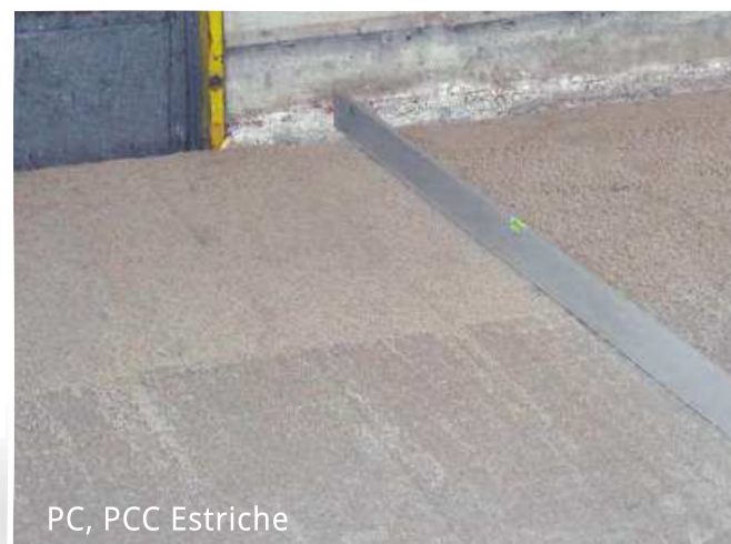
PC, PCC Estriche