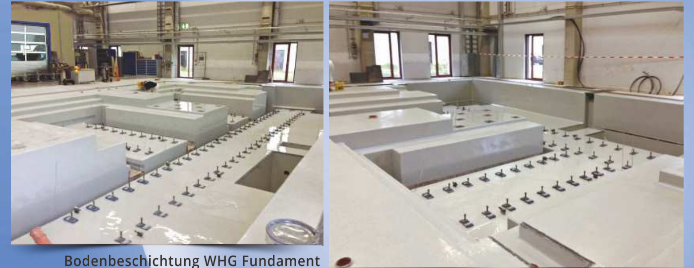
Bodenbeschichtung WHG Fundament

Eine zuverlässige Beratung und ein sicherer Sanierungsvorschlag sind unser Garant für eine langjährige Zusammenarbeit. Vielfältige Anforderungen und Aufgabenstellungen an Ihren Böden verlangen eine kompetente Verarbeitung.