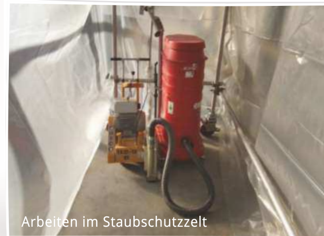
Arbeiten im Staubschutzzelt